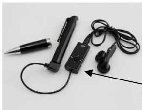
Télécommande par câble